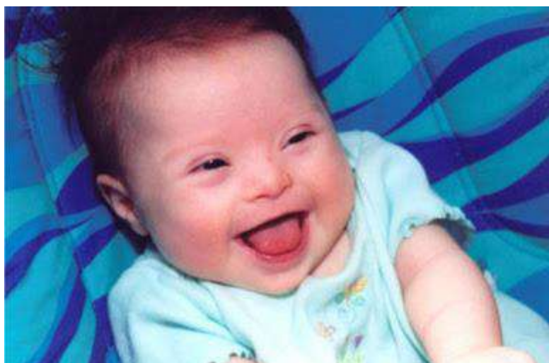
FIGURA 4. Criança portadora da Síndrome de Down.

O importante é que desde o nascimento, os portadores da síndrome de Down sejam estimulados, para que sejam capazes de vencer as limitações que essa alteração genética lhes impõe, e de desenvolver todo seu potencial. Como têm necessidades específicas de saúde e aprendizagem, exigem assistência profissional multidisciplinar e atenção permanente dos pais (SILVA E KLEINHANS, 2006). O objetivo deve ser sempre habilitá-las para o convívio e a participação social (Figura 4).