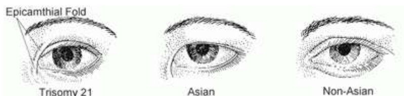
FIGURA 2. Aspectos comparativos do formato dos olhos em pessoas com SD, asiáticos e não asiáticos (LEITE, [s.d.] 2014).

Conforme o site ghente , há uma inclinação lateral dos olhos para cima (olhos puxadinhos) e prega epicântica (pálpebra superior é deslocada para o canto interno), semelhante ao dos orientais. As pálpebras são estreitas e levemente oblíquas (Figura 2).